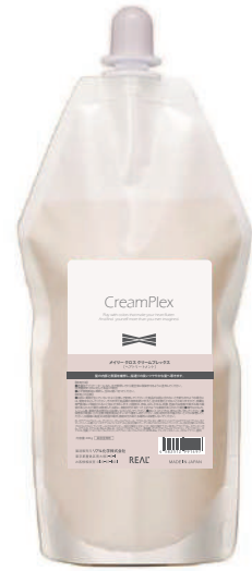
メイリークロス クリームプレックス 内容量：400g

ヘアカラー施術によるダメージ低減と共に、 「柔らかさ」と「ツヤ」を与える酸化染毛剤用補助料です。 ダメージを低減することで、 繰り返しのカラー施術や高強度カラーにも楽しめます。 「柔らかさ」と「ツヤ」を向上することで、 お客様に効果を実感いただける質感に仕上がります。